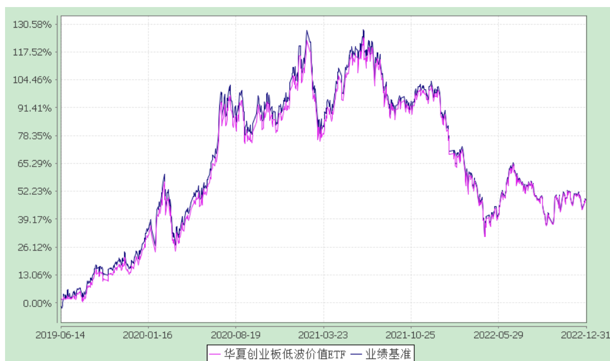
华夏创业板低波蓝筹交易型开放式指数证券投资基金 份额累计净值增长率与业绩比较基准收益率历史走势对比图 (2019年6月14日至2022年12月31日)

3.2.3 自基金合同生效以来基金每年净值增长率及其与同期业绩比较基准收益率的比较