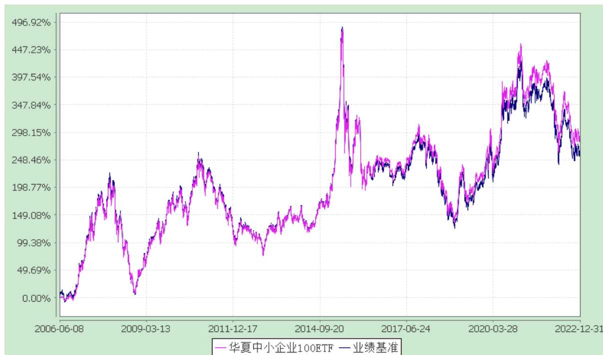
中小企业 100 交易型开放式指数基金 份额累计净值增长率与业绩比较基准收益率历史走势对比图 (2006 年 6 月 8 日至 2022 年 12 月 31 日)