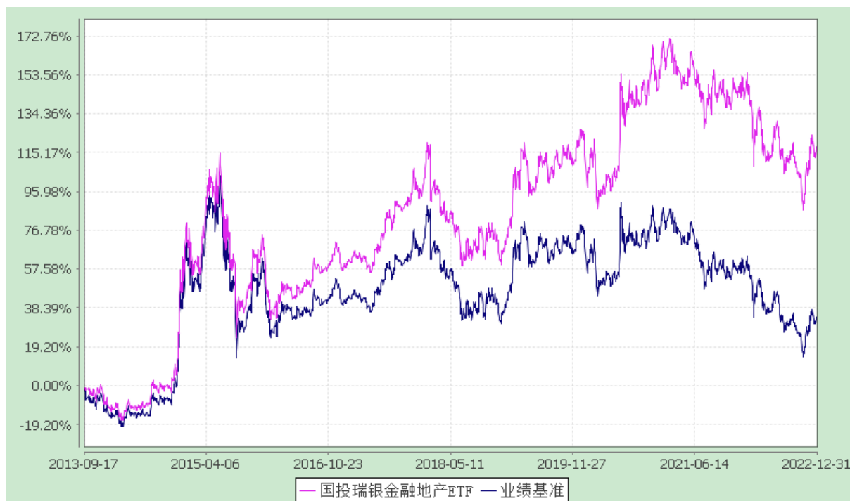
份额累计净值增长率与业绩比较基准收益率的历史走势对比图 (2013 年 9 月 17 日至 2022 年 12 月 31 日)

注：本基金建仓期为自基金合同生效日起的 3 个月。截至建仓期结束，本基金各项资产配置比例符合基金合同及招募说明书有关投资比例的约定。