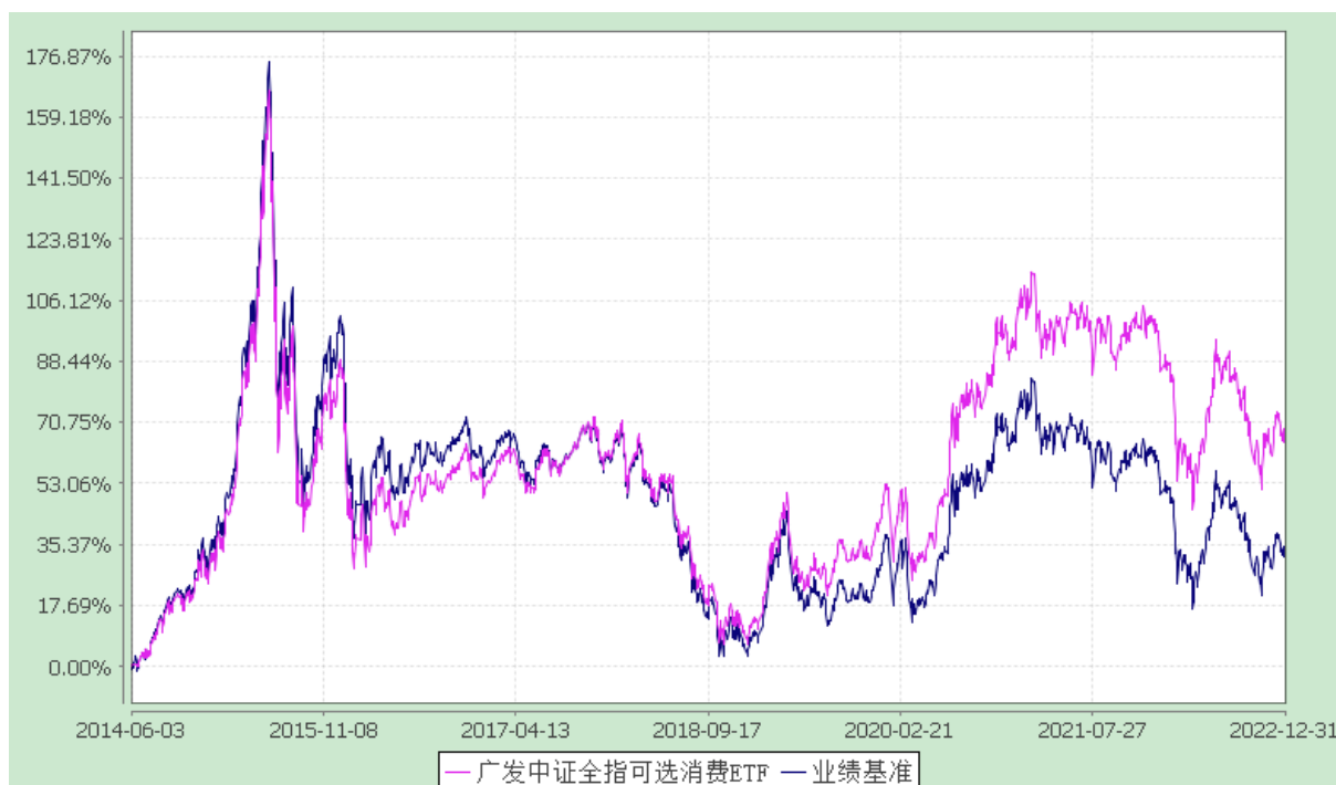
广发中证全指可选消费交易型开放式指数证券投资基金 份额累计净值增长率与业绩比较基准收益率的历史走势对比图 (2014 年 6 月 3 日至 2022 年 12 月 31 日)