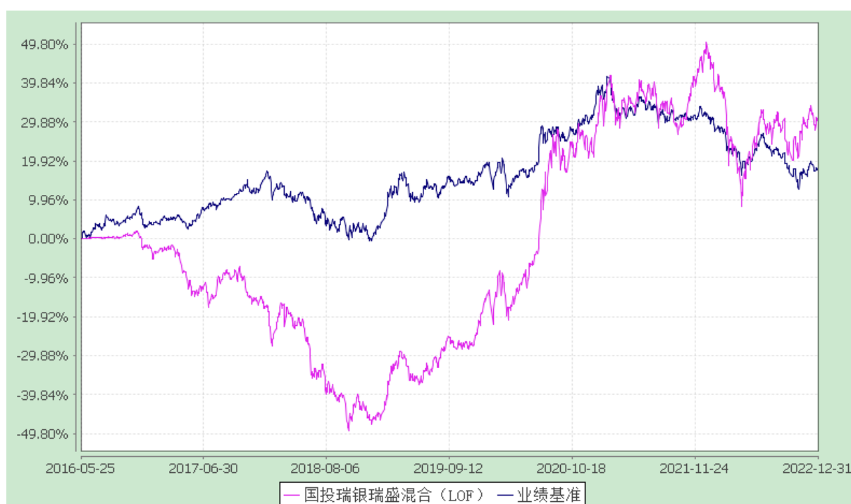
国投瑞银瑞盛灵活配置混合型证券投资基金(LOF) 份额累计净值增长率与业绩比较基准收益率的历史走势对比图 (2016 年 5 月 25 日至 2022 年 12 月 31 日)

注：本基金建仓期为自基金合同生效日起的 6 个月。截至建仓期结束，本基金各项资产配置比例符合基金合同及招募说明书有关投资比例的约定。