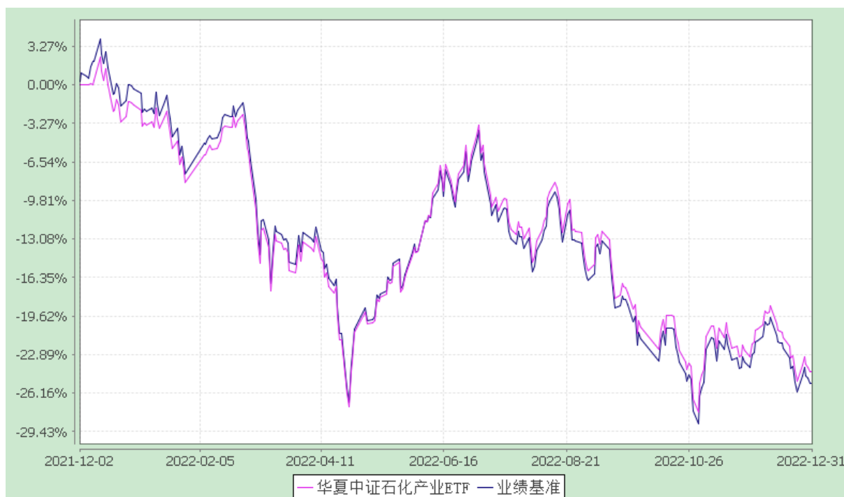
华夏中证石化产业交易型开放式指数证券投资基金 份额累计净值增长率与业绩比较基准收益率历史走势对比图 (2021 年 12 月 2 日至 2022 年 12 月 31 日)

注：根据本基金的基金合同规定，本基金自基金合同生效之日起 6 个月内使基金的投资组合比例符合本基金合同中投资范围、投资限制的有关约定。