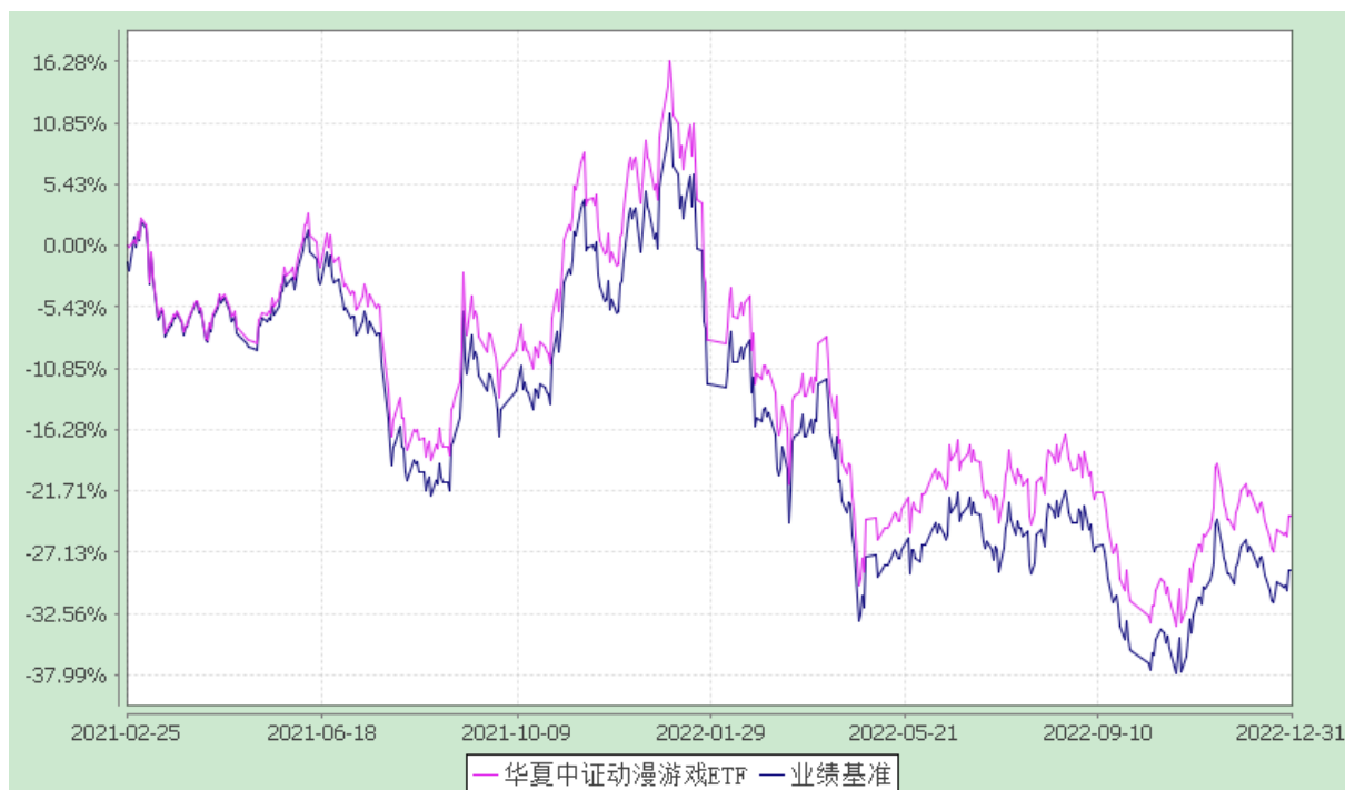
华夏中证动漫游戏交易型开放式指数证券投资基金 份额累计净值增长率与业绩比较基准收益率历史走势对比图 (2021 年 2 月 25 日至 2022 年 12 月 31 日)