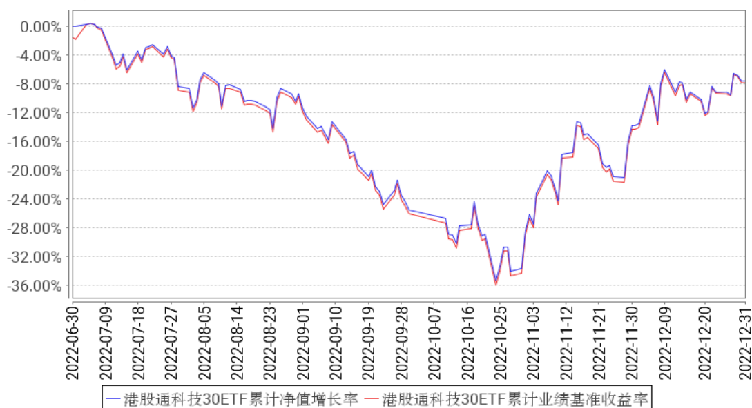
港股通科技30ETF累计净值增长率与同期业绩比较基准收益率的历史走势对比图

注：1、本基金基金合同于 2022 年 06 月 30 日生效。截至报告期末，本基金基金合同生效不满一年。