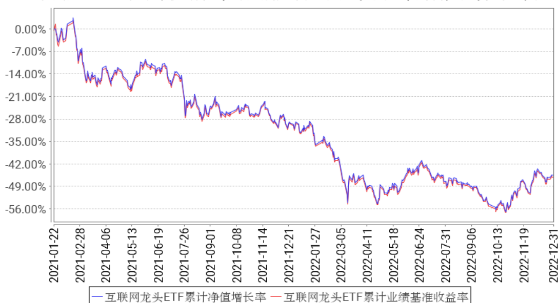
互联网龙头ETF累计净值增长率与同期业绩比较基准收益率的历史走势对比图