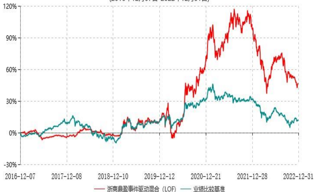
浙商汇金鼎盈事件驱动灵活配置混合型证券投资基金(LOF)累计净值增长率与业绩比较基准收益率历史走势对比图 (2016年12月07日-2022年12月31日)