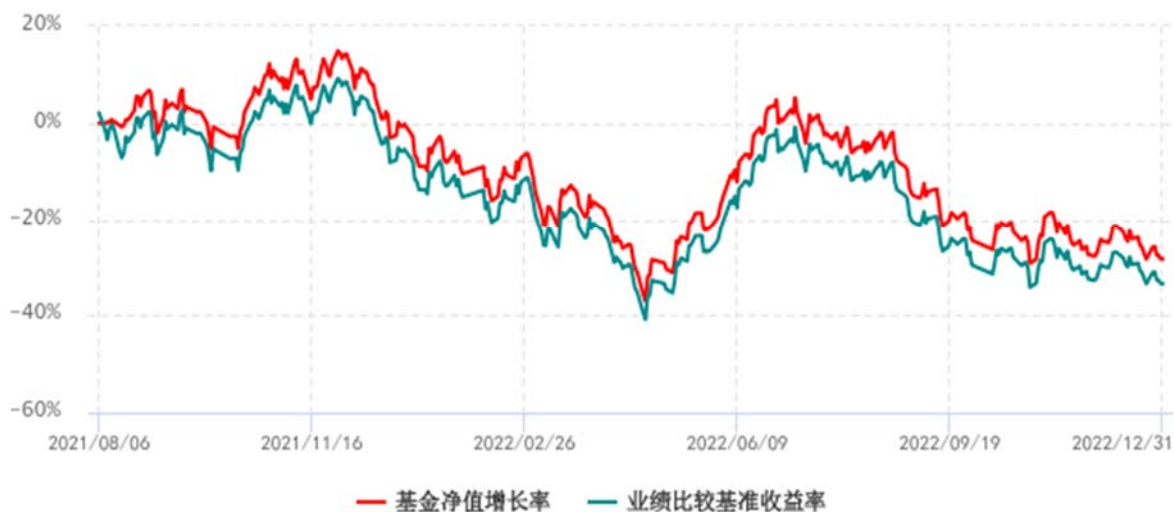
基金份额累计净值增长率与同期业绩比较基准收益率历史走势对比图 (2021年08月06日-2022年12月31日)

注：1、本基金成立于 2021 年 8 月 6 日；2、比较基准：国证新能源车电池指数收益率。