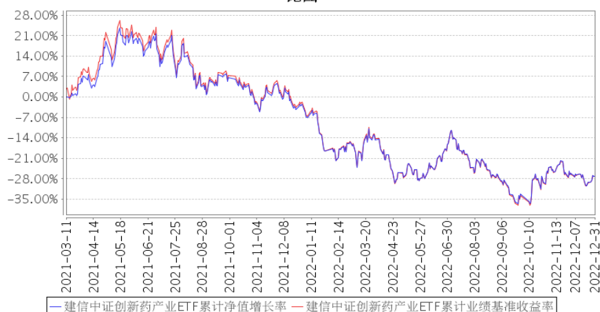
建信中证创新药产业ETF累计净值增长率与同期业绩比较基准收益率的历史走势对比图