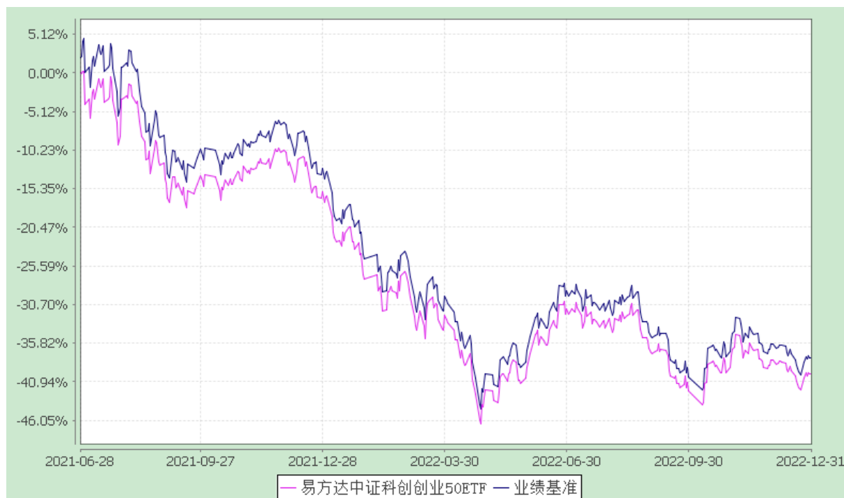
易方达中证科创创业 50 交易型开放式指数证券投资基金 份额累计净值增长率与业绩比较基准收益率历史走势对比图 (2021 年 6 月 28 日至 2022 年 12 月 31 日)

注：自基金合同生效至报告期末，基金份额净值增长率为-39.87%，同期业绩比较基准收益率为-37.72%。