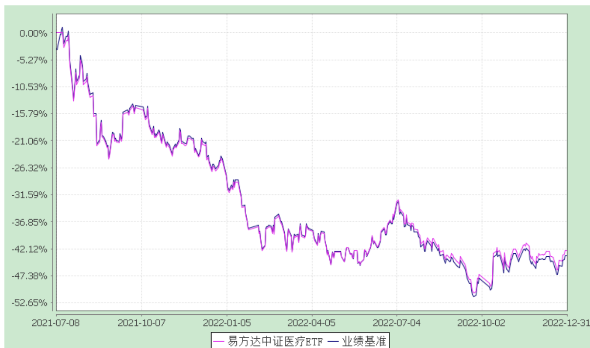
易方达中证医疗交易型开放式指数证券投资基金 份额累计净值增长率与业绩比较基准收益率历史走势对比图 (2021年7月8日至2022年12月31日)

注：1.按基金合同和招募说明书的约定，本基金的建仓期为六个月，建仓期结束时各项资产配置比例符合基金合同（第十四部分二、投资范围，三、投资策略和四、投资限制）的有关约定。