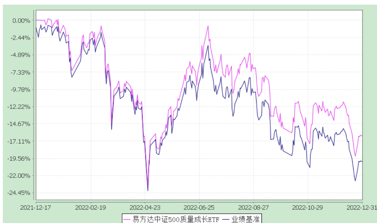
易方达中证 500 质量成长交易型开放式指数证券投资基金 份额累计净值增长率与业绩比较基准收益率历史走势对比图 (2021 年 12 月 17 日至 2022 年 12 月 31 日)

注：1.按基金合同和招募说明书的约定，本基金的建仓期为六个月，建仓期结束时各项资产配置比例符合基金合同（第十四部分二、投资范围，三、投资策略和四、投资限制）的有关约定。