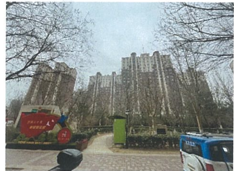
南至世华龙樾商品住房小区