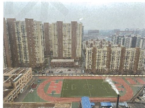
南至第八十中学管庄分校（汇星校区）