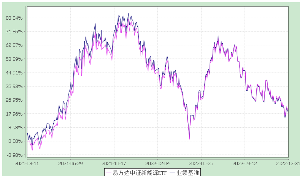
易方达中证新能源交易型开放式指数证券投资基金 份额累计净值增长率与业绩比较基准收益率历史走势对比图 (2021年3月11日至2022年12月31日)

注：自基金合同生效至报告期末，基金份额净值增长率为 20.58%，同期业绩比较基准收益率为 19.49%。