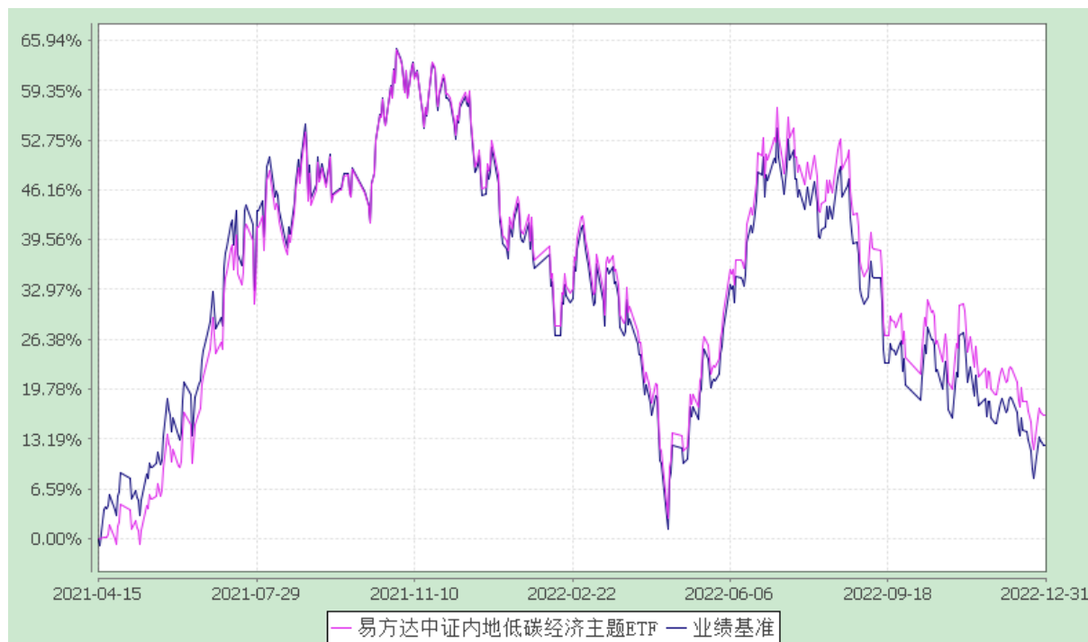
易方达中证内地低碳经济主题交易型开放式指数证券投资基金 份额累计净值增长率与业绩比较基准收益率历史走势对比图 (2021 年 4 月 15 日至 2022 年 12 月 31 日)

注：自基金合同生效至报告期末，基金份额净值增长率为 16.26%，同期业绩比较基准收益率为 12.30%。