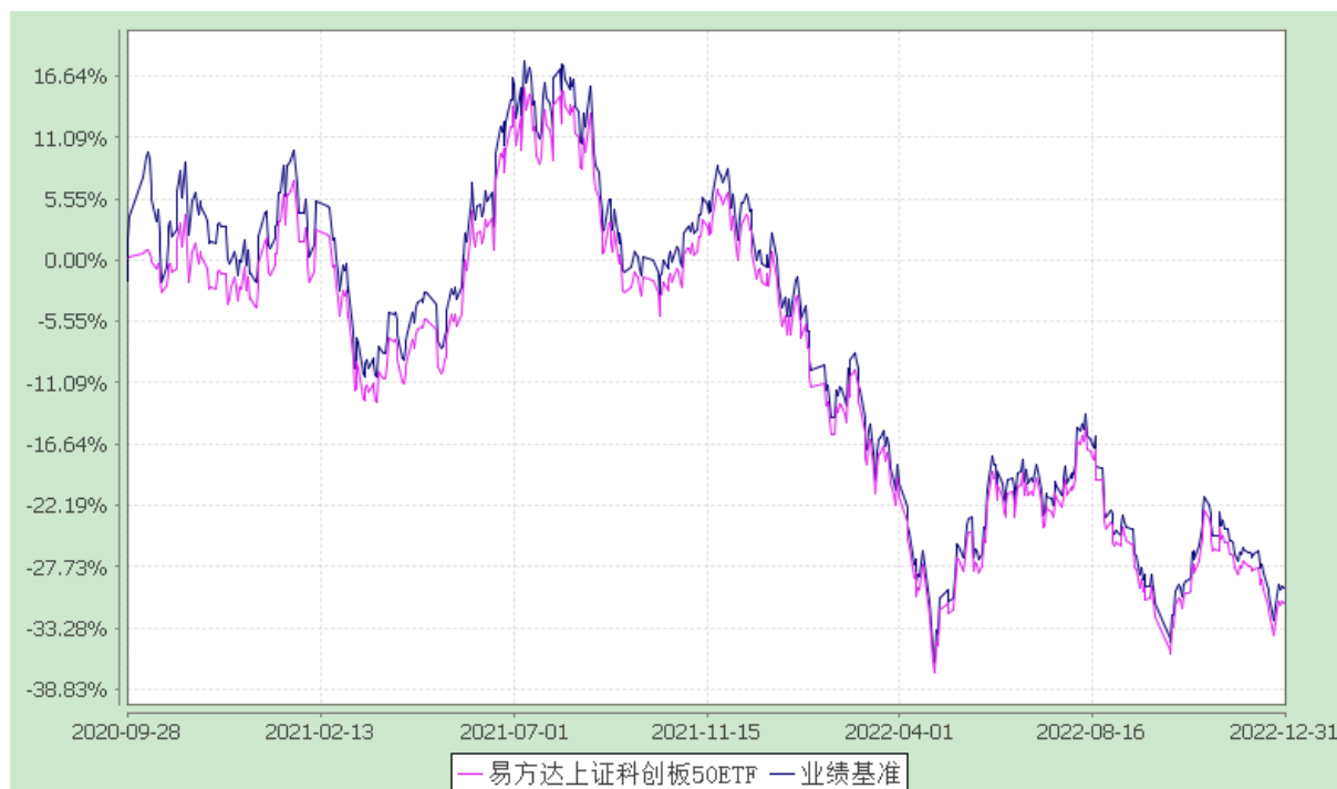
易方达上证科创板 50 成份交易型开放式指数证券投资基金 份额累计净值增长率与业绩比较基准收益率历史走势对比图 (2020 年 9 月 28 日至 2022 年 12 月 31 日)

注：自基金合同生效至报告期末，基金份额净值增长率为-31.09%，同期业绩比较基准收益率为-29.63%。