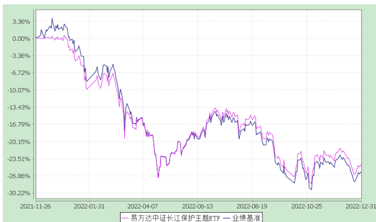
易方达中证长江保护主题交易型开放式指数证券投资基金 份额累计净值增长率与业绩比较基准收益率历史走势对比图 （2021 年 11 月 26 日至 2022 年 12 月 31 日）

注：1.按基金合同和招募说明书的约定，本基金的建仓期为六个月，建仓期结束时各项资产配置比例符合基金合同（第十四部分二、投资范围，三、投资策略和四、投资限制）的有关约定。