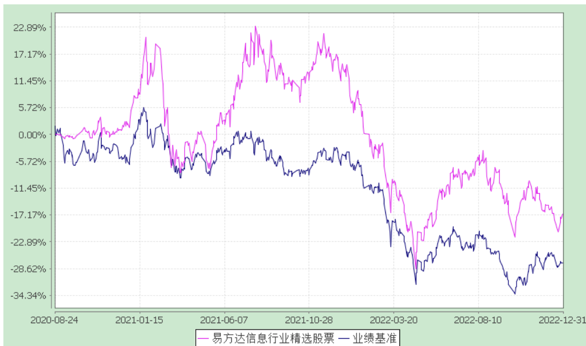
易方达信息行业精选股票型证券投资基金 份额累计净值增长率与业绩比较基准收益率历史走势对比图 (2020 年 8 月 24 日至 2022 年 12 月 31 日)

注：自基金合同生效至报告期末，基金份额净值增长率为-16.97%，同期业绩比较基准收益率为-27.39%。