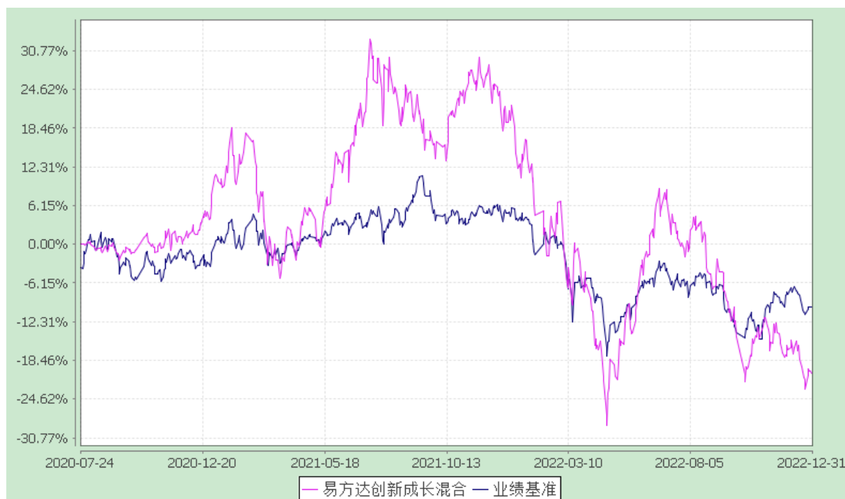
易方达创新成长混合型证券投资基金 份额累计净值增长率与业绩比较基准收益率历史走势对比图 (2020 年 7 月 24 日至 2022 年 12 月 31 日)

注：自基金合同生效至报告期末，基金份额净值增长率为-20.49%，同期业绩比较基准收益率为-10.01%。