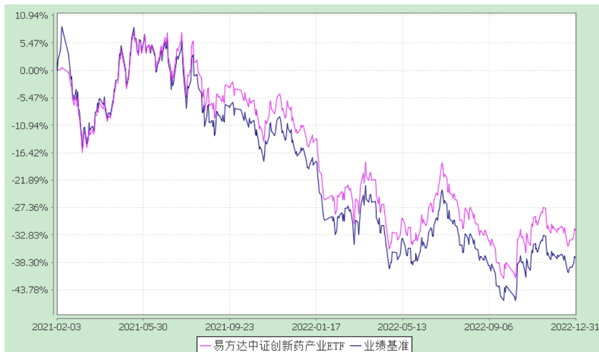
易方达中证创新药产业交易型开放式指数证券投资基金 份额累计净值增长率与业绩比较基准收益率历史走势对比图 (2021年2月3日至2022年12月31日)

注：自基金合同生效至报告期末，基金份额净值增长率为-31.80%，同期业绩比较基准收益率为-37.32%。