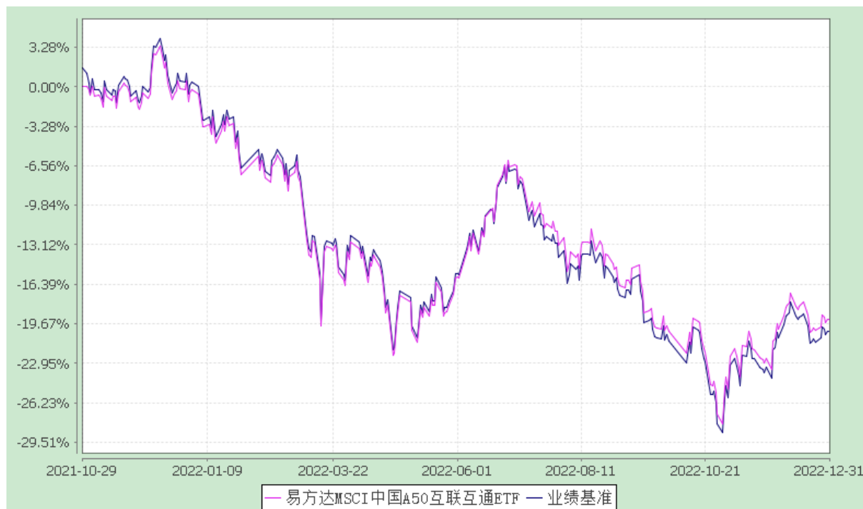
易方达 MSCI 中国 A50 互联互通交易型开放式指数证券投资基金 份额累计净值增长率与业绩比较基准收益率历史走势对比图 (2021 年 10 月 29 日至 2022 年 12 月 31 日)

注：1.按基金合同和招募说明书的约定，本基金的建仓期为六个月，建仓期结束时各项资产配置比例符合基金合同（第十四部分二、投资范围，三、投资策略和四、投资限制）的有关约定。