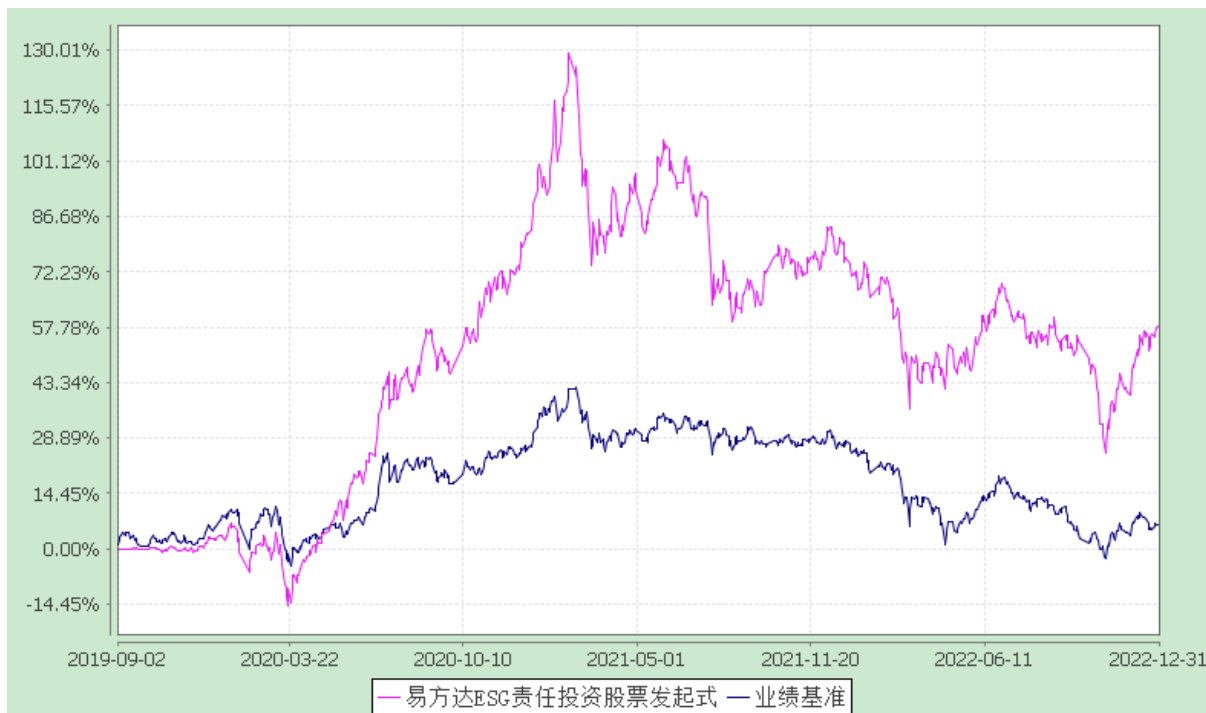
易方达 ESG 责任投资股票型发起式证券投资基金 份额累计净值增长率与业绩比较基准收益率历史走势对比图 (2019 年 9 月 2 日至 2022 年 12 月 31 日)

注：自基金合同生效至报告期末，基金份额净值增长率为 58.05%，同期业绩比较基准收益率为 6.29%。