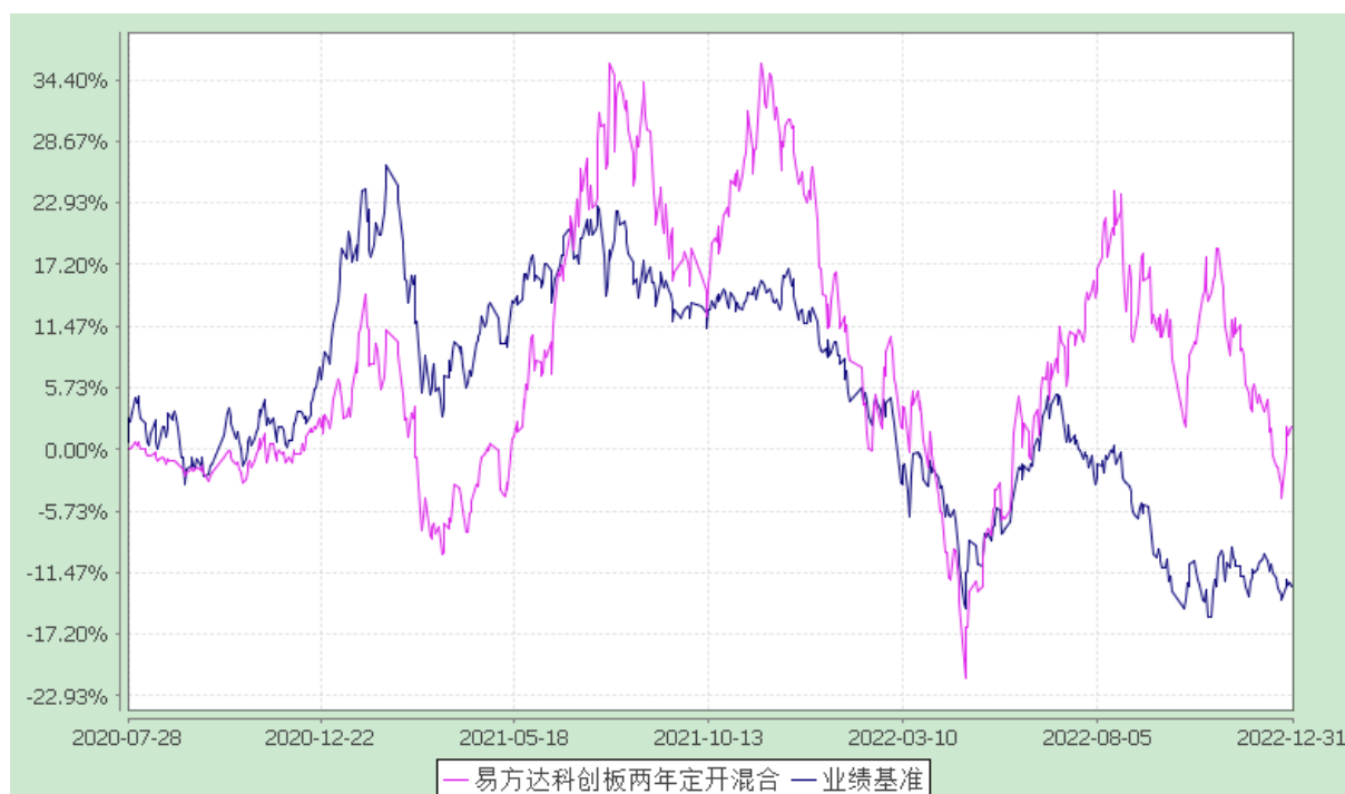
易方达科创板两年定期开放混合型证券投资基金 份额累计净值增长率与业绩比较基准收益率历史走势对比图 (2020年7月28日至2022年12月31日)

注：自基金合同生效至报告期末，基金份额净值增长率为 2.04%，同期业绩比较基准收益率为 -12.67%。