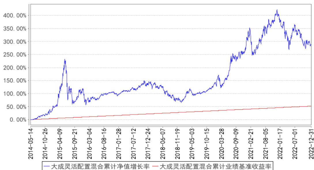
大成灵活配置混合累计净值增长率与同期业绩比较基准收益率的历史走势对比图

注：按本基金合同规定，基金管理人应当自基金合同生效之日起六个月内使基金的投资组合比例符合基金合同的约定。建仓期结束时，本基金的投资组合比例符合基金合同的约定。