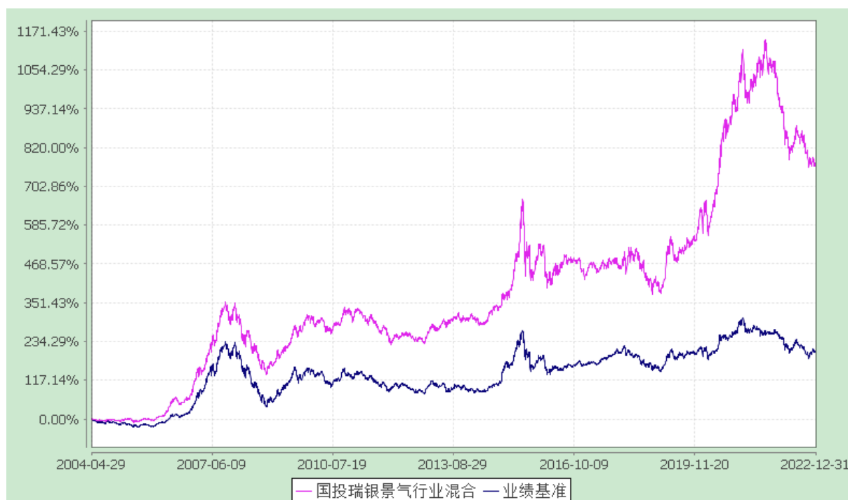
国投瑞银景气行业证券投资基金 份额累计净值增长率与业绩比较基准收益率的历史走势对比图 (2004 年 4 月 29 日至 2022 年 12 月 31 日)

注：本基金建仓期为自基金合同生效日起的 6 个月。截至建仓期结束，本基金各项资产配置比例符合基金合同及招募说明书有关投资比例的约定。