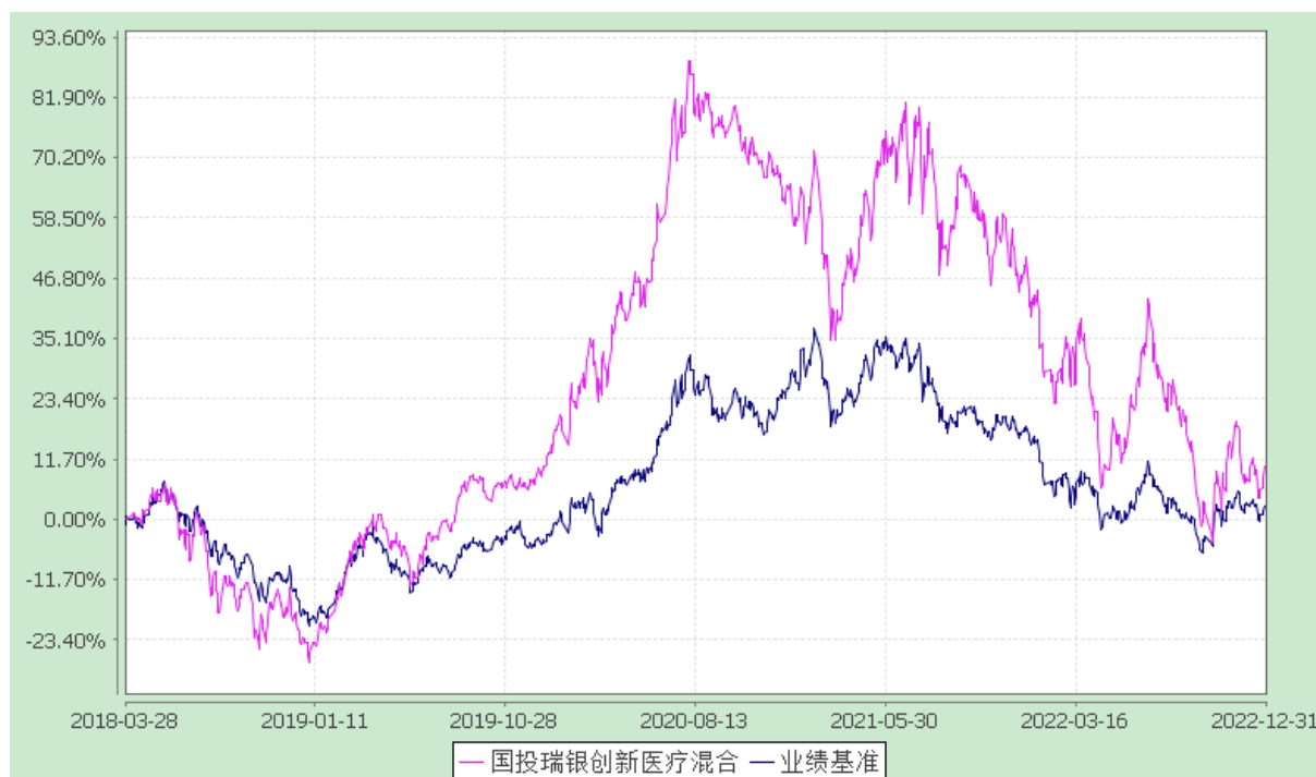
国投瑞银创新医疗灵活配置混合型证券投资基金 份额累计净值增长率与业绩比较基准收益率的历史走势对比图 (2018年3月28日至2022年12月31日)

注：本基金建仓期为自基金合同生效日起的6个月。截至建仓期结束，本基金各项资产配置比例符合基金合同及招募说明书有关投资比例的约定。