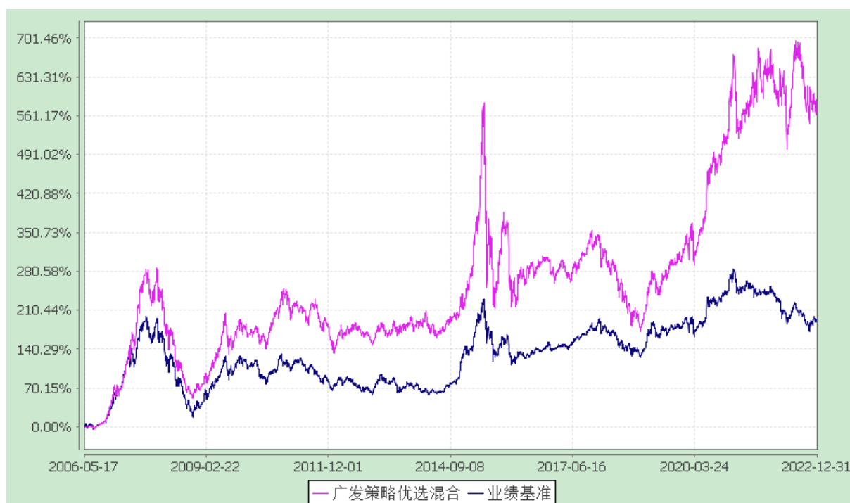
广发策略优选混合型证券投资基金 份额累计净值增长率与业绩比较基准收益率的历史走势对比图 (2006 年 5 月 17 日至 2022 年 12 月 31 日)

注：自 2013 年 1 月 17 日起，本基金的业绩比较基准由“新华富时 A600 指数×75%+新华巴克莱资本中国全债指数×25%”变更为“沪深 300 指数×75%+中证全债指数×25%”。