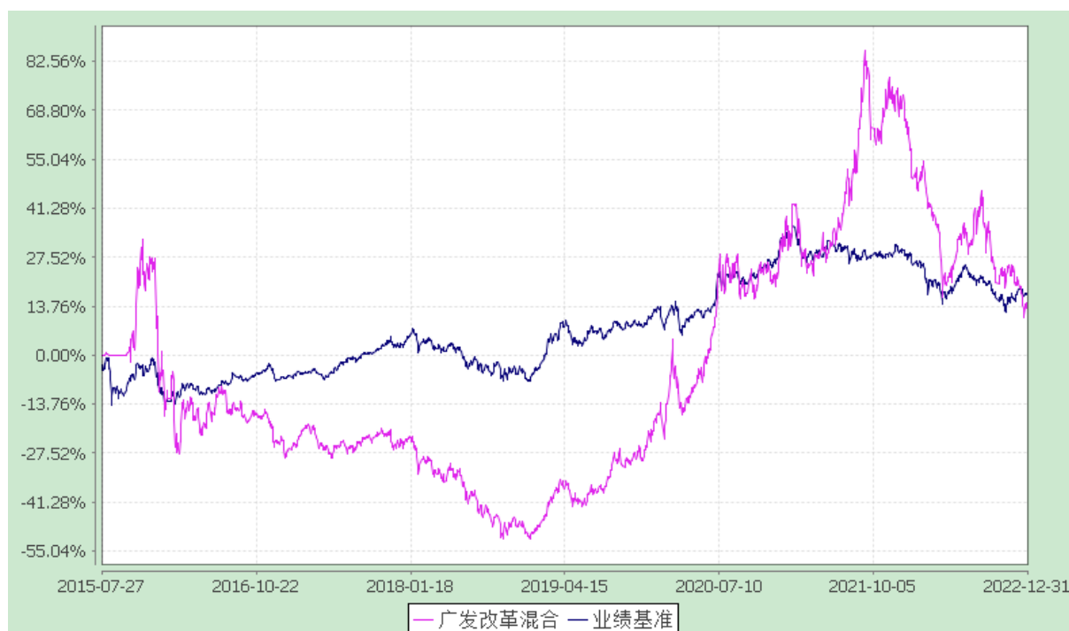
广发改革先锋灵活配置混合型证券投资基金 份额累计净值增长率与业绩比较基准收益率的历史走势对比图 (2015 年 7 月 27 日至 2022 年 12 月 31 日)