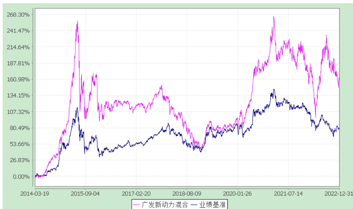
广发新动力混合型证券投资基金 份额累计净值增长率与业绩比较基准收益率的历史走势对比图 (2014 年 3 月 19 日至 2022 年 12 月 31 日)

注：自 2020 年 1 月 10 日起，本基金的业绩比较基准由“沪深 300 指数×80%+中证全债指数×20%”变更为“沪深 300 指数×80%+中债-综合财富（总值）指数×10%+银行活期存款利率（税后）×10%”。