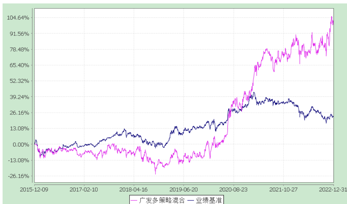
广发多策略灵活配置混合型证券投资基金 份额累计净值增长率与业绩比较基准收益率的历史走势对比图 (2015 年 12 月 9 日至 2022 年 12 月 31 日)