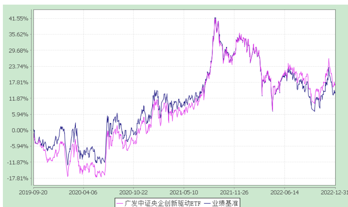
广发中证央企创新驱动交易型开放式指数证券投资基金 份额累计净值增长率与业绩比较基准收益率的历史走势对比图 (2019 年 9 月 20 日至 2022 年 12 月 31 日)