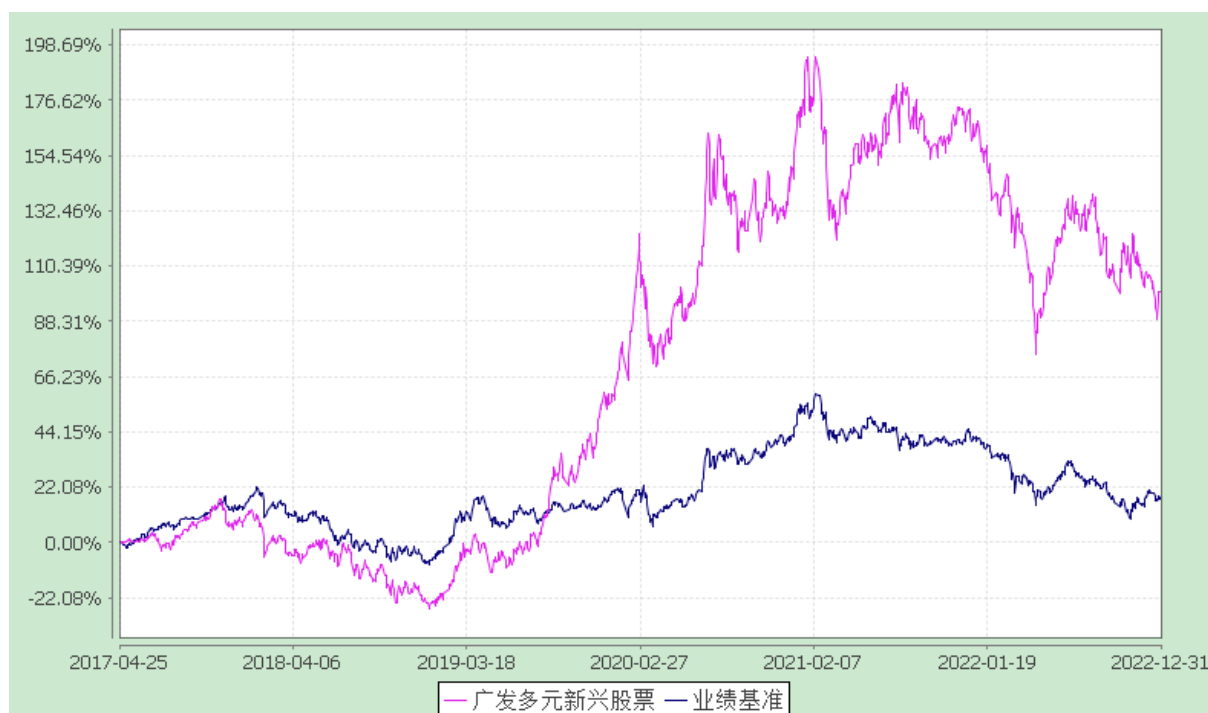
广发多元新兴股票型证券投资基金 份额累计净值增长率与业绩比较基准收益率的历史走势对比图 (2017 年 4 月 25 日至 2022 年 12 月 31 日)