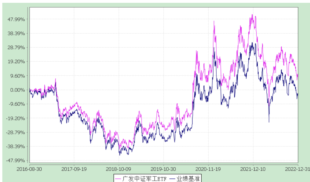
广发中证军工交易型开放式指数证券投资基金 份额累计净值增长率与业绩比较基准收益率的历史走势对比图 (2016年8月30日至2022年12月31日)