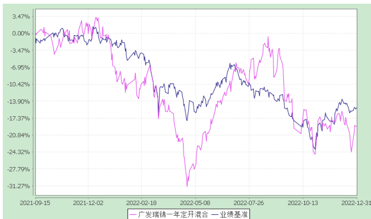
广发瑞锦一年定期开放混合型证券投资基金 份额累计净值增长率与业绩比较基准收益率的历史走势对比图 (2021 年 9 月 15 日至 2022 年 12 月 31 日)

注：本基金建仓期为基金合同生效后 6 个月，建仓期结束时各项资产配置比例符合本基金合同有关规定。