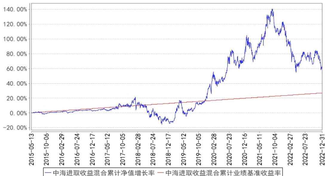
中海进取收益混合累计净值增长率与同期业绩比较基准收益率的历史走势对比图