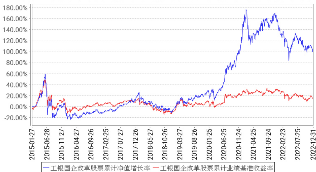
工银国企改革股票累计净值增长率与同期业绩比较基准收益率的历史走势对比图