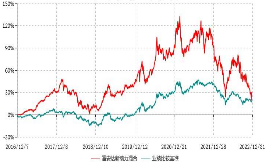
富安达新动力灵活配置混合型证券投资基金累计净值增长率与业绩比较基准收益率历史走势对比图 (2016年12月07日-2022年12月31日)