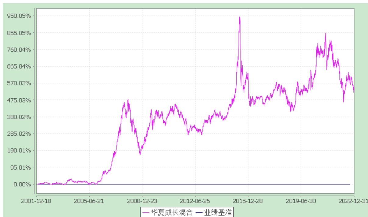
华夏成长证券投资基金 份额累计净值增长率与业绩比较基准收益率历史走势对比图 (2001 年 12 月 18 日至 2022 年 12 月 31 日)