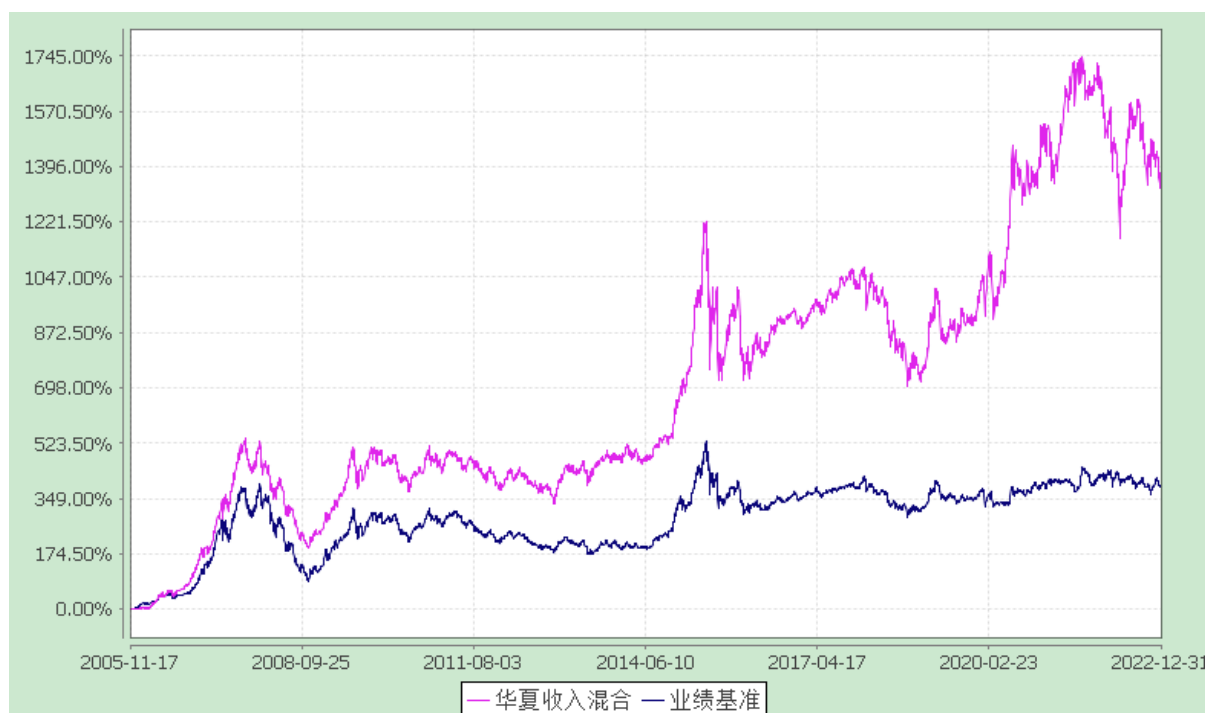
华夏收入混合型证券投资基金 份额累计净值增长率与业绩比较基准收益率历史走势对比图 (2005 年 11 月 17 日至 2022 年 12 月 31 日)