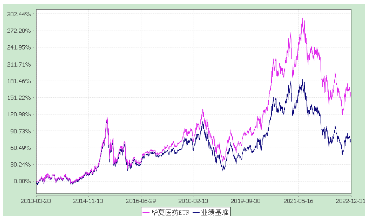
上证医药卫生交易型开放式指数发起式证券投资基金 份额累计净值增长率与业绩比较基准收益率历史走势对比图 (2013年3月28日至2022年12月31日)