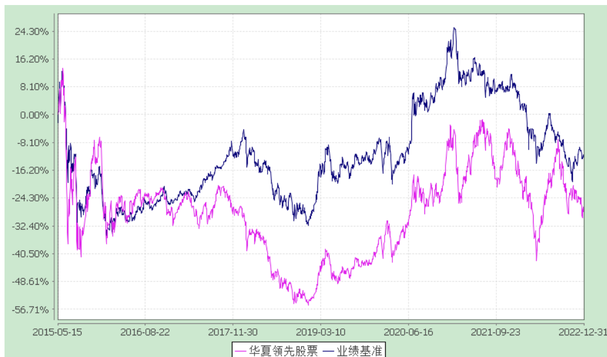
华夏领先股票型证券投资基金 份额累计净值增长率与业绩比较基准收益率历史走势对比图 (2015年5月15日至2022年12月31日)