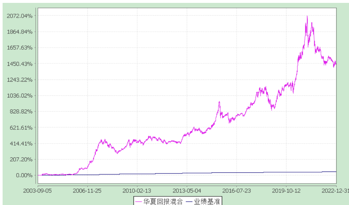
华夏回报证券投资基金 份额累计净值增长率与业绩比较基准收益率历史走势对比图 (2003年9月5日至2022年12月31日)