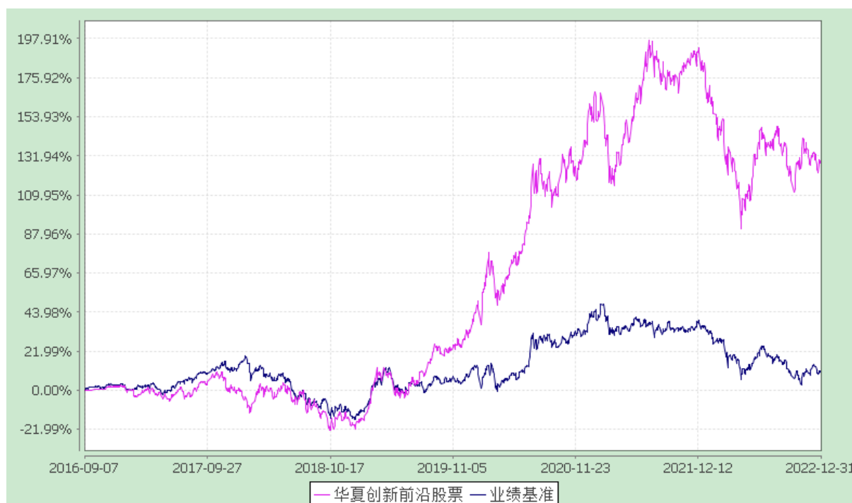
华夏创新前沿股票型证券投资基金 份额累计净值增长率与业绩比较基准收益率历史走势对比图 (2016年9月7日至2022年12月31日)