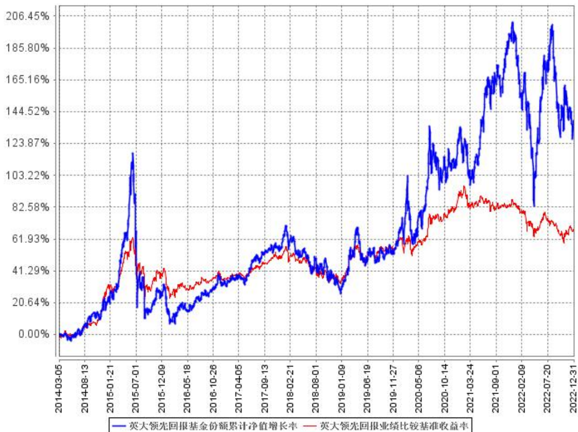
英大领先回报基金份额累计净值增长率与同期业绩比较基准收益率的历史走势对比图