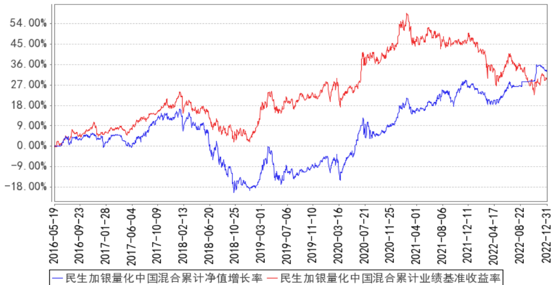
民生加银量化中国混合累计净值增长率与同期业绩比较基准收益率的历史走势对比图

注：本基金合同于 2016 年 5 月 19 日生效，本基金建仓期为自基金合同生效日起的 6 个月。截至建仓期结束，本基金各项资产配置比例符合基金合同及招募说明书有关投资比例的约定。