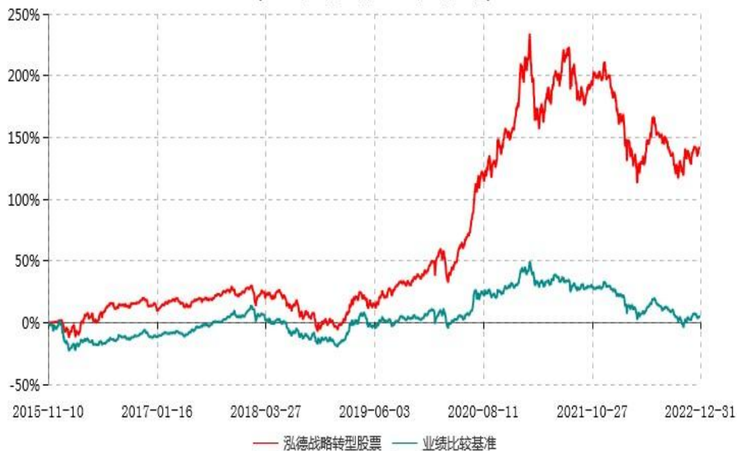
泓德战略转型股票型证券投资基金累计净值增长率与业绩比较基准收益率历史走势对比图 (2015年11月10日-2022年12月31日)

注：根据基金合同的约定，本基金建仓期为6个月，截至报告期末，本基金的各项投资比例符合基金合同关于投资范围及投资限制规定。