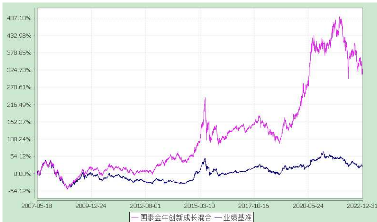
自基金合同生效以来份额累计净值增长率与业绩比较基准收益率的历史走势对比图 (2007 年 5 月 18 日至 2022 年 12 月 31 日)

注：本基金合同生效日为 2007 年 5 月 18 日。本基金在六个月建仓期结束时，各项资产配置比例符合合同约定。